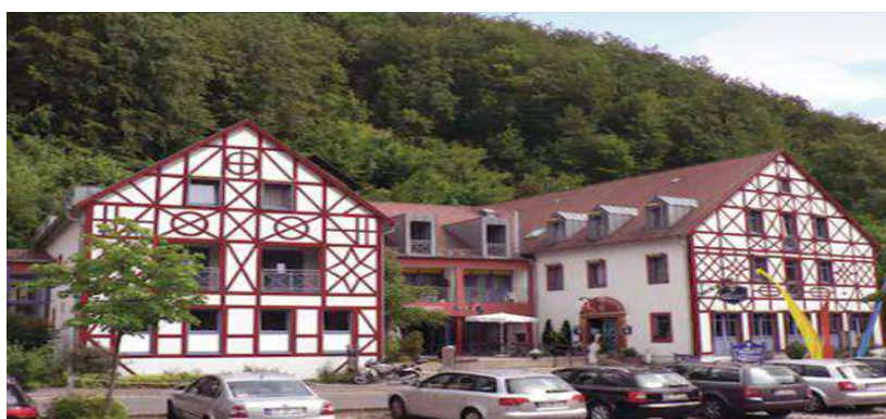
Behringers Freizeit und Tagungshotel

Gegen 17.00Uhr werden wir unsere Unterkunft in Gößweinstein, Behringers Freizeit und Tagungshotel, erreichen. Nach der Zimmerverteilung gibt es um 18.30 Uhr dann ein 3 Gänge Menü zum Abendessen. Anschließend werden wir mit einem gemütlichen Beisammensein auch im Biergarten gemeinsam den Abend ausklingen lassen.