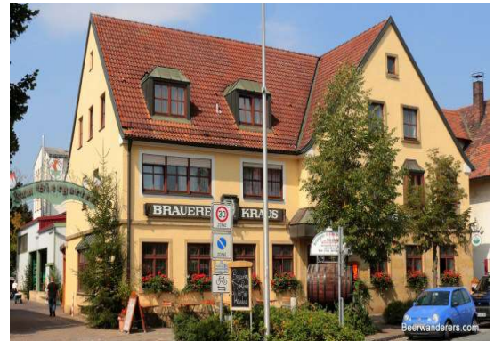
Brauerei Gasthof Kraus

Gegen 18.°° Uhr sind wir dann wieder am Feuerwehrhaus in Lämmerspiel.