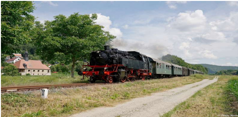
Dampfbahn fränkische Schweiz

Der 15.05.2022 ist unser Abreisetag. Nach dem Frühstück und dem Auschecken werden wir mit der historischen Dampfbahn der Fränkischen Schweiz eine Fahrt durch das schöne Wisenttal nach Ebermannstadt machen. Dann begeben wir uns auf die Heimreise, jedoch werden wir noch einmal im Brauerei Gasthof Kraus in Hirschaid bei leckerer fränkischer Küche Abschied nehmen von einem hoffentlich Interessanten Ausflug für Sie Alle.