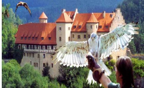
Falknerei vor Burg Rabenstein